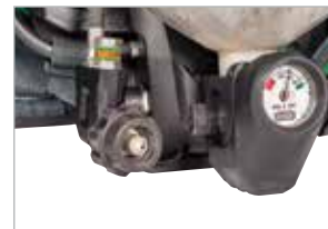
Threaded remote connection

* Versión de perfil bajo del cilindro de 45 min, 4500 psig