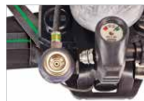
Quick-connect remote connection

* Versión de perfil bajo del cilindro de 45min, 4500 psig